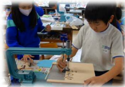
文字の部品を切り抜こう