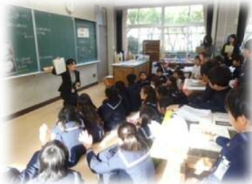
アイデアスケッチや試作品を見合う