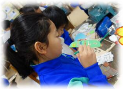
明るい色で着色しよう