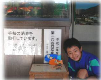
魚が重なって泳いで見えるよ