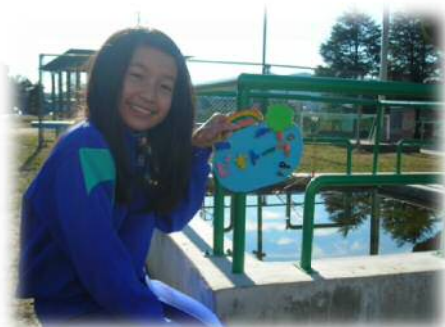
空に映った空の色と同じだよ