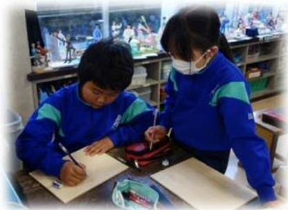
全体の形を取ろう