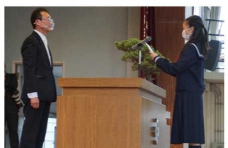
新入生代表誓いの言葉