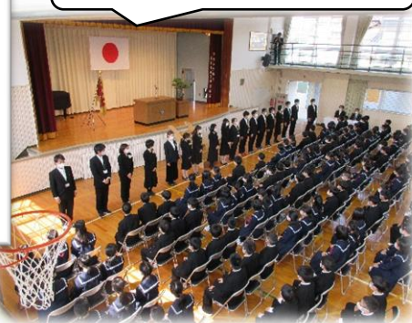
入学式での教員紹介