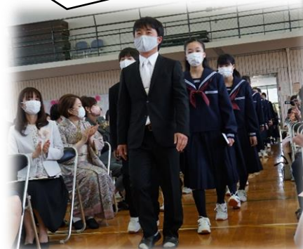
入学式 新入生入場

今年度も生徒、教職員が、一丸となって真摯に附属中学校をつくりあげてまいりますので、地域や保護者の皆様のご理解とご支援をどうぞよろしくお願いいたします。